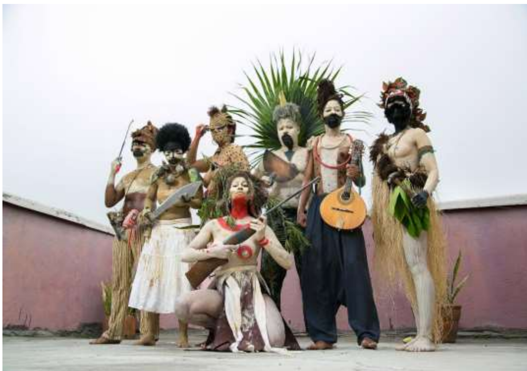
Figura 2 – Cena de Alguma coisa a ver com uma missão , 2016.

O espetáculo da companhia paulistana Os Crespos parte da investigação sobre as evoluções locais e revoluções políticas latino-americanas, a partir dos levantes negros no Brasil e no Caribe, tendo em vista a construção imaginária de uma revolução poética a favor da abolição do racismo. O cenário da peça é o centro da cidade de São Paulo (figura 2). O espetáculo tem início nas escadarias do Theatro Municipal, onde o público é abordado por seis personagens e conduzido à Praça Ramos de Azevedo. Aborda-se uma história de lutas negras por liberdade. Acompanhando duas personagens – uma gari e uma auxiliar de enfermagem – que recebem um convite para viajar no tempo pelas águas da Calunga, em meio a personagens em levante, o público reconhece trajetórias invisibilizadas pela história oficial. (PORTAL GELEDÉS, 26 out. 2016).