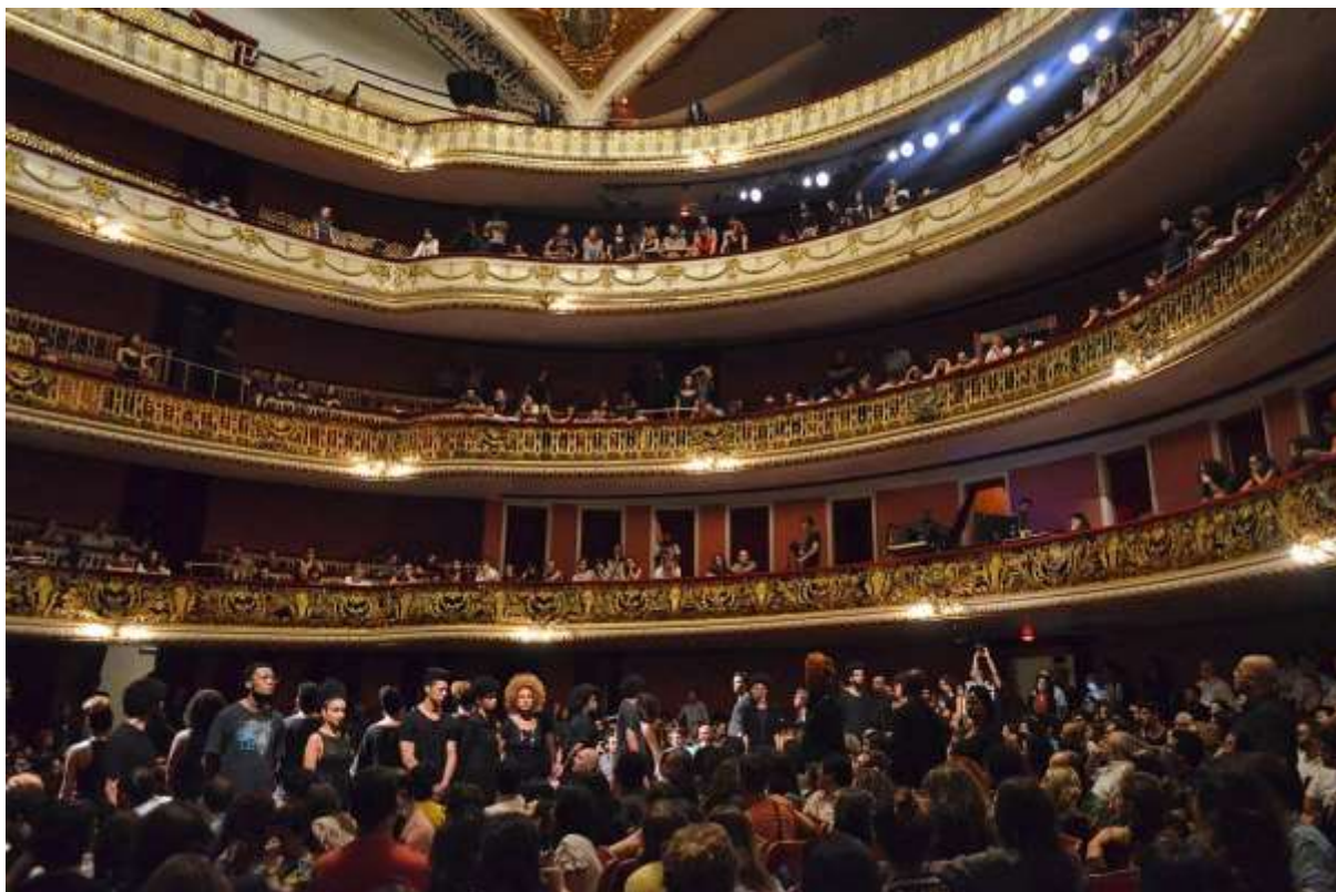
Figura 5 – Cena da performance em Legítima Defesa, 2016.