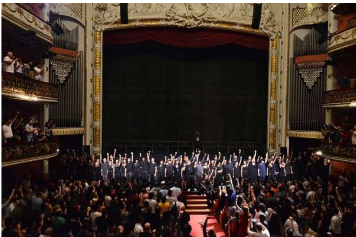
Figura 6 – Cena da performance em Legítima Defesa, 2016.

Assinalamos que o movimento que englobou a performance Em Legítima Defesa , desde sua concepção, mobilização dos artistas, recorte artístico da proposta, acontecimento, encontro com o público e repercussão após a realização, propõe um novo humanismo, partindo das vivências e potências do corpo negro.