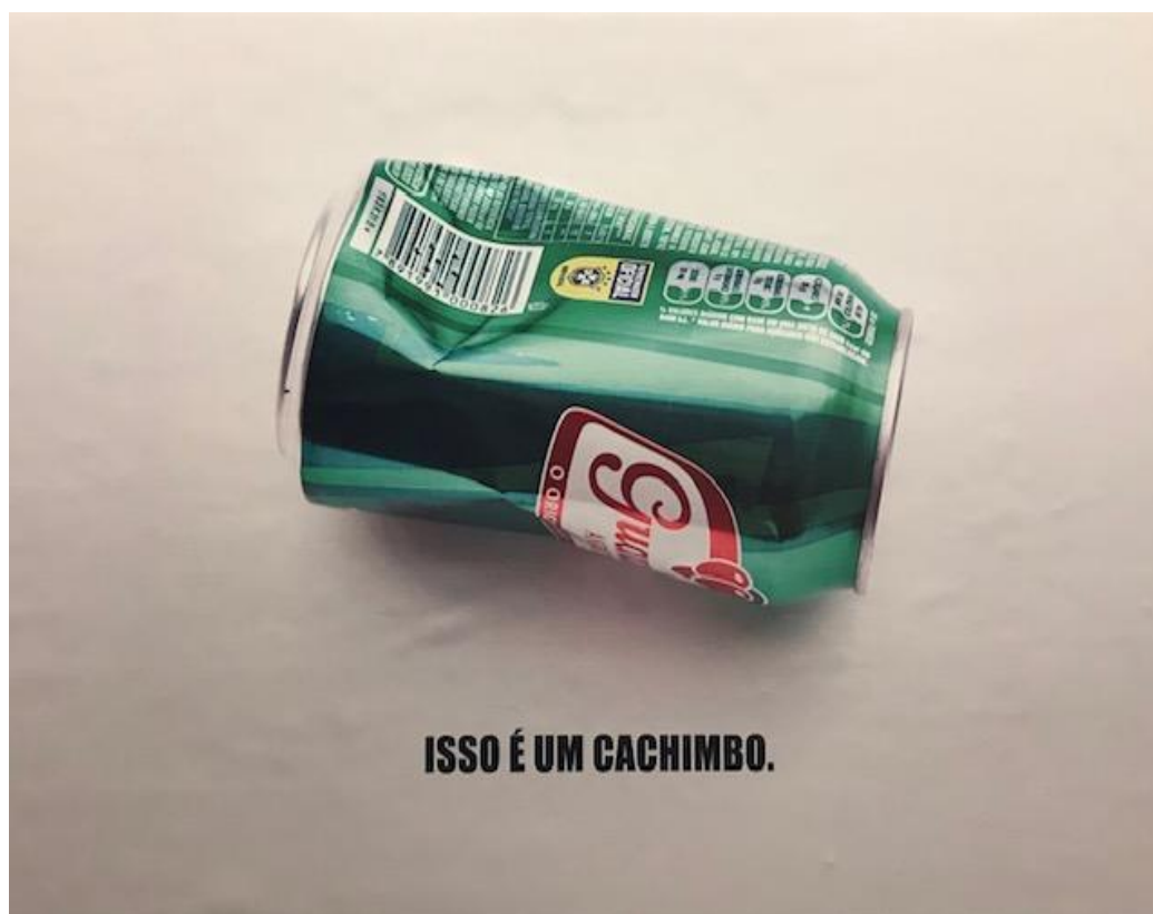
Figura 6 - Exposição Birico - Poéticas Autônomas em Fluxo - 8 de outubro de 2021.

Ao subir os andares do edifício para caminhar efetivamente pela exposição, a primeira obra que recebia o visitante, Isso é um cachimbo (vide Figura 6), do artista Dentinho, atravessava o espaço e convidava à reflexão sobre a conhecida e complexa realidade da região da Cracolândia.