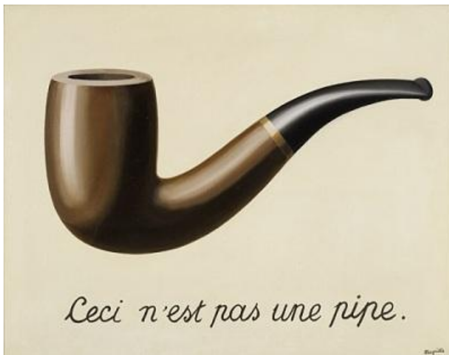
Figura 7 - René Magritte, The Treachery of Images (This Is Not a Pipe).

(La Trahison des images [Ceci n'est pas une pipe]), 1929, purchased with funds provided by the Mr. and Mrs. William Preston Harrison Collection, © 2013 C. Herscovici, London / Artists Rights Society (ARS), New York.