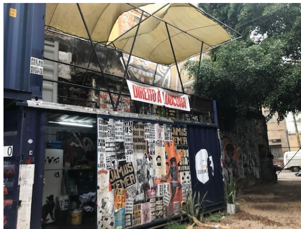
Figura 2 - Sede do Coletivo Birico - 16 de março de 2022.

O valor arrecadado nas campanhas, também contribuiu para somar ao espaço do Teatro de Contêiner Mungunzá a estrutura da sede do Coletivo Tem Sentimento, projeto que atua na geração de renda para mulheres cis e trans por meio de trabalho de costura. Dois contêineres foram adicionados ao terreno para o ateliê de costura do Coletivo, que no período da pandemia confeccionou e distribuiu máscaras para população em situação de rua e moradores do entorno, além da entrega diária de marmitas. Foram distribuídas mais de cinco mil máscaras de tecido ao longo do primeiro ano de pandemia e, de acordo com as informações disponibilizadas no site da Cia. Mungunzá de Teatro / Teatro de Contêiner Mungunzá, dos sessenta e cinco mil reais gastos na sede do ateliê de costura do Coletivo Tem Sentimento, treze mil reais vieram do projeto Birico, via venda de obras de arte dos artistas do coletivo.