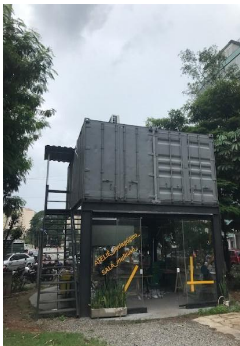
Figura 4 - Sala Mungunzá Multiuso - 16 de março de 2022.

Conforme apresentado acima, as ações desenvolvidas e apoiadas pelo coletivo frente à crise sanitária da Covid-19 foram organizadas em algumas iniciativas: Moradia Primeiro, Biricar, Escola Livre de Artes, Distribuição de Máscaras e Apoio a Agentes Locais (SESC, 2022). A partir dessa atuação consistente na região, o coletivo Birico tem sido fonte de apoio e resistência cultural ativa na chamada Cracolândia.