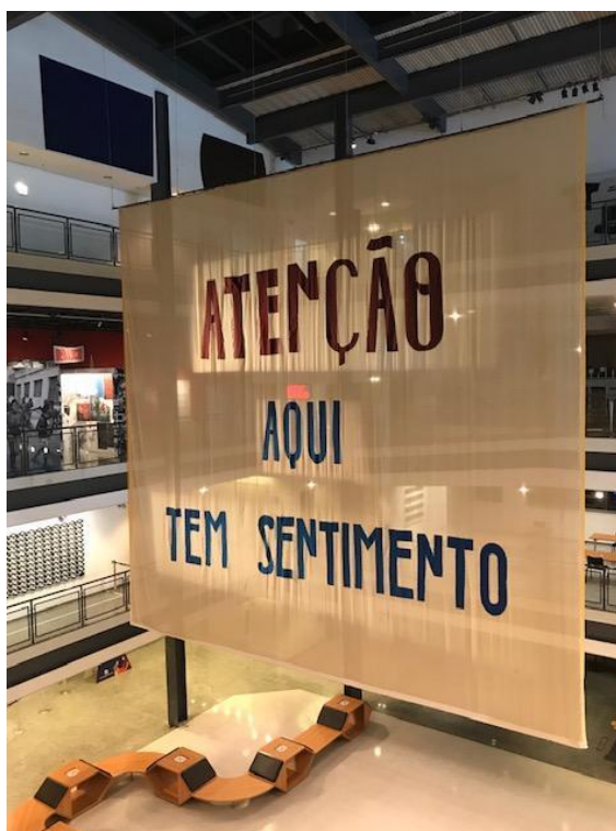
Figura 5 - Exposição Birico - Poéticas Autônomas em Fluxo - 8 de outubro de 2021.

A experiência de imersão no Sesc Bom Retiro, em São Paulo, durante a exposição Birico - Poéticas Autônomas em Fluxo , era impactante e a frase: “ATENÇÃO AQUI TEM SENTIMENTO”, escrita em uma bandeira de escala muito ampliada – cerca de 5 x 5 metros – estendida pela totalidade de altura dos andares da unidade, ocupando a largura de toda a praça de convivência do espaço do SESC, trazia outra dimensão ao trabalho do coletivo.