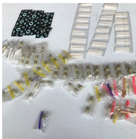
Figura 3 - Biricar - 16 de março de 2022.

A ação Biricar , conforme vivenciado em março de 2022, realiza a distribuição desses insumos atrelados a atividades voltadas à expressão artística. Tal iniciativa convida os frequentadores da região a reunirem-se ao redor da estrutura do Biricar para expressar opinião, realizar atividade artística, ou contar histórias (podendo ser datilografada em uma máquina de escrever), ouvindo o som de um clarinete ou pagode, estabelecendo assim uma relação de diálogo e confiança, tornando a entrega dos insumos mais eficaz e descontraída.