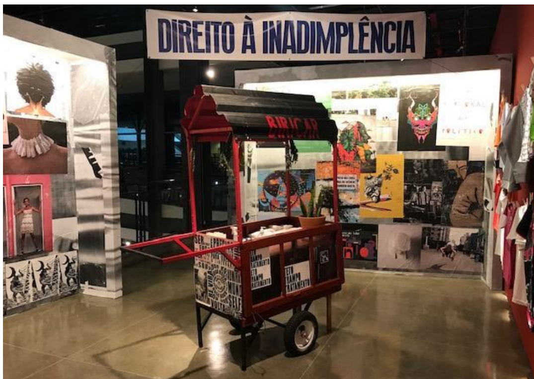
Figura 8 - Exposição Birico - Poéticas Autônomas em Fluxo - 8 de outubro de 2021.

Em evidência na exposição, era possível conectar-se com uma homenagem ao rapper e militante MC Kawex (KOMBAT ARGUMENT WAR EXTREME), conhecido pela sua criação musical e atuação nos projetos na região da Cracolândia, falecido em fevereiro de 2021. Em sua rede social, no dia 15 de fevereiro de 2021, o Coletivo Birico fez circular a seguinte declaração: