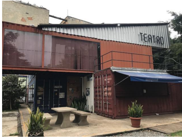
Figura 1 - Teatro de Contêiner Mungunzá - 16 de março de 2022.