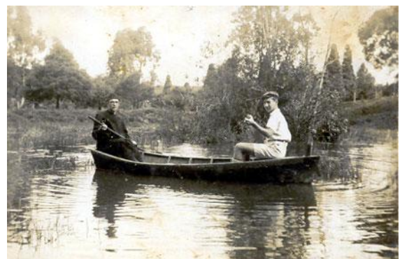
Várzea onde hoje é o Largo do Taboão

A rua de terra batida deu lugar a rodovia Régis Bittencourt (BR-116)