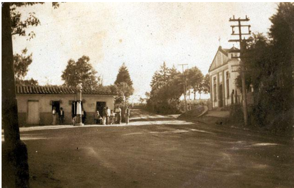
Taboão da Serra antes da emancipação (déc. 40).

Já no século XX, por volta de 1910, ocupações mais afluentes foram ocorrendo por pequenas chácaras que produziam batatas, cenouras e mandiocas, além de pomares e parreiras. Em seguida, uma colônia de férias foi instalada para os padres da Igreja Católica, devido a sua posição territorial privilegiada pelo clima ameno. Data do ano de 1953 as primeiras reuniões dos moradores reivindicando a emancipação do subdistrito de Itapecerica da Serra. Através de um plebiscito local uma comissão foi formada e pode levar à Assembléia Legislativa de São Paulo o pedido de emancipação. Em 19/02/1959 o pedido foi publicado em diário oficial e Taboão da Serra passou a ser um município autônomo no Estado de São Paulo.