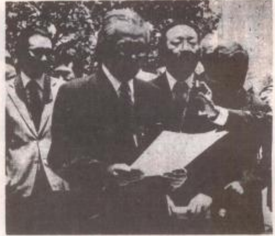
O consul fala durante o lançamento da pedra fundamental