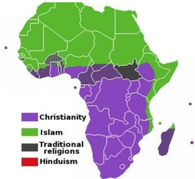
Figura 4: Divisão religiosa da África