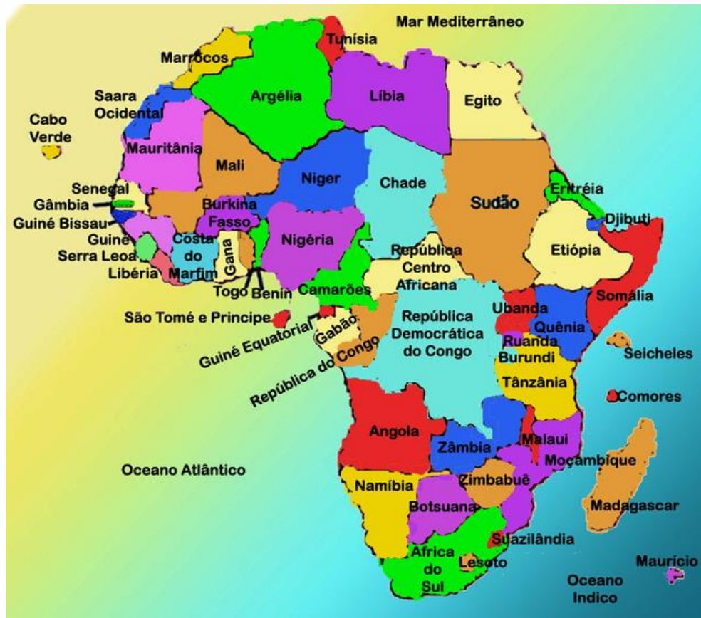
Figura 2: Mapa Geopolítico da África