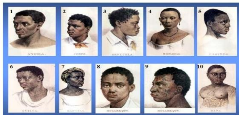
Rugendas, diferentes etnias, 1820.

(1) Angola, (2) Congo, (3) Bengüela, (4) Monjolo, (5) Cabinda, (6) Quiloa, (7) Rebolo, (8) e (9) Moçambique, (10) Mina. As etnias de 1-5 e 7 são da África central, 8-9 são do sudeste africano e 10 é da África ocidental. A presença de um escravo Quiloa é peculiar, pois essa é uma etnia da África Oriental, região da qual vieram muito poucos escravos para o Brasil. Todos, com exceção da escrava da Mina, falavam dialetos da família Bantu.